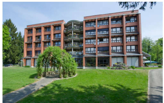
Seniorenzentrum Zofingen - Tanner