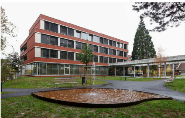
Seniorenzentrum Zofingen - Brunnenhof